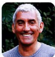
KRANKING-Erfinder Johnny G.

Neben der Sichtung von potenziellen Education-Representatives bietet sich